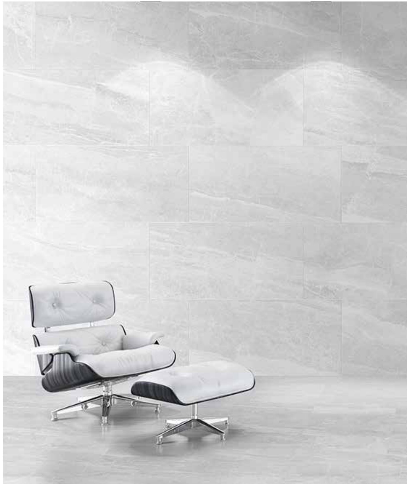
RIVESTIMENTO . WALL: Cashmere, White 60x120 . 24"x48", 6 mm Rettificato . Rectified