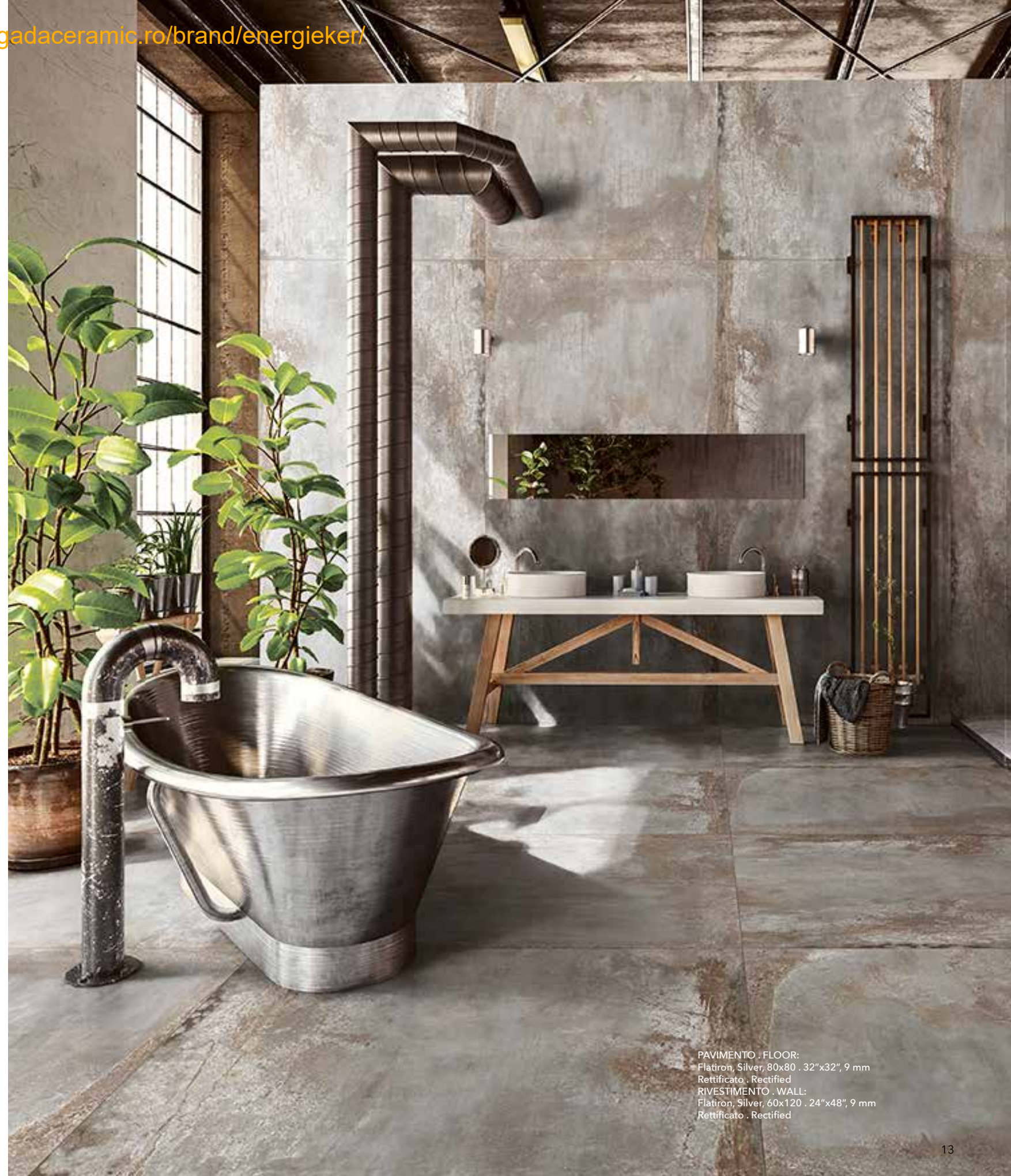
PAVIMENTO . FLOOR: Flatiron, Silver, 80x80 . 32"x32", 9 mm Rettificato . Rectified RIVESTIMENTO . WALL: Flatiron, Silver, 60x120 . 24"x48", 9 mm Rettificato . Rectified