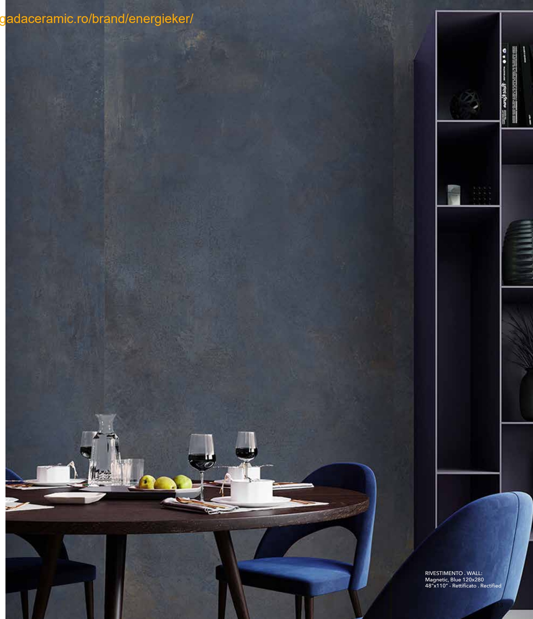
RIVESTIMENTO . WALL: Magnetic, Blue 120x280 48"x110" - Rettificato . Rectified

TH2.0 - PEZZI SPECIALI PAG. 132 TH2.0 - SPECIAL PIECES. - PIÈCES SPÉCIALES. - FORMTEILE.