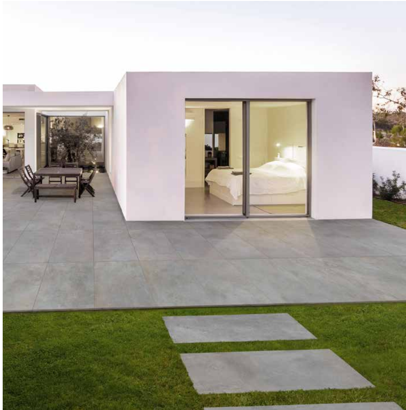
PAVIMENTO . FLOOR: Magnetic, Grey 60x120 24"x48", 20 mm . TH2.0 - Rettificato . Rectified

OUTDOOR PAVIMENTO . FLOOR: Magnetic, Grey 60x120 . 24"x48", 20 mm TH2.0 Rettificato . Rectified Magnetic, Grey Round lineare 30x120 . 12"x48", 20 mm TH2.0 - Rettificato . Rectified Magnetic, Grey Round angolare DX / SX 30x120 . 12"x48", 20 mm TH2.0 - Rettificato . Rectified