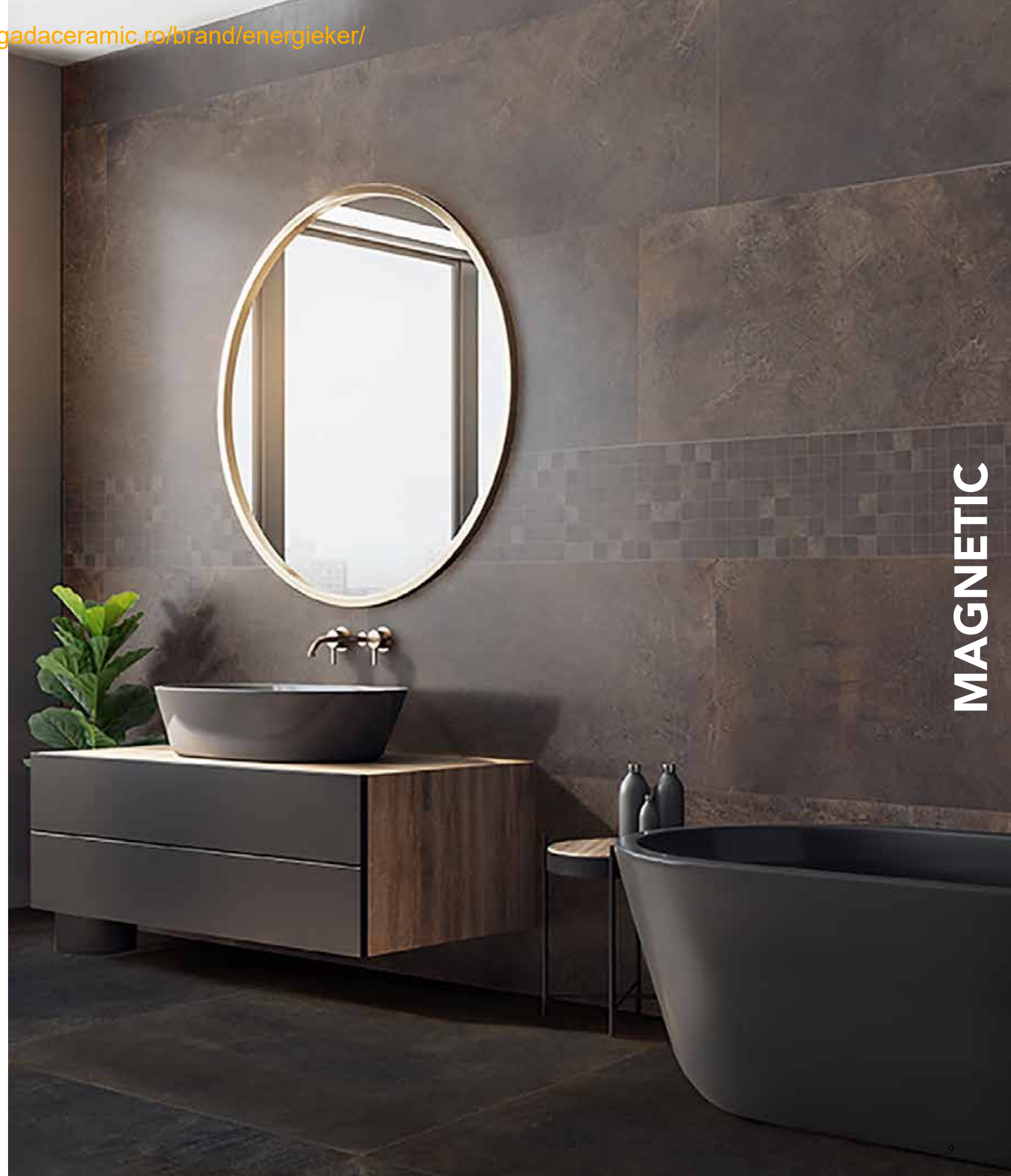
RIVESTIMENTO . WALL: Magnetic, Bronze 60x120 . 24"x48", 9 mm - Rettificato . Rectified / Magnetic, Bronze Mosaico 36 PZ 30x30 . 12"x12" - Naturale . Natural PAVIMENTO . FLOOR: Magnetic, Black 120x120 . 48"x48", 9 mm - Rettificato . Rectified