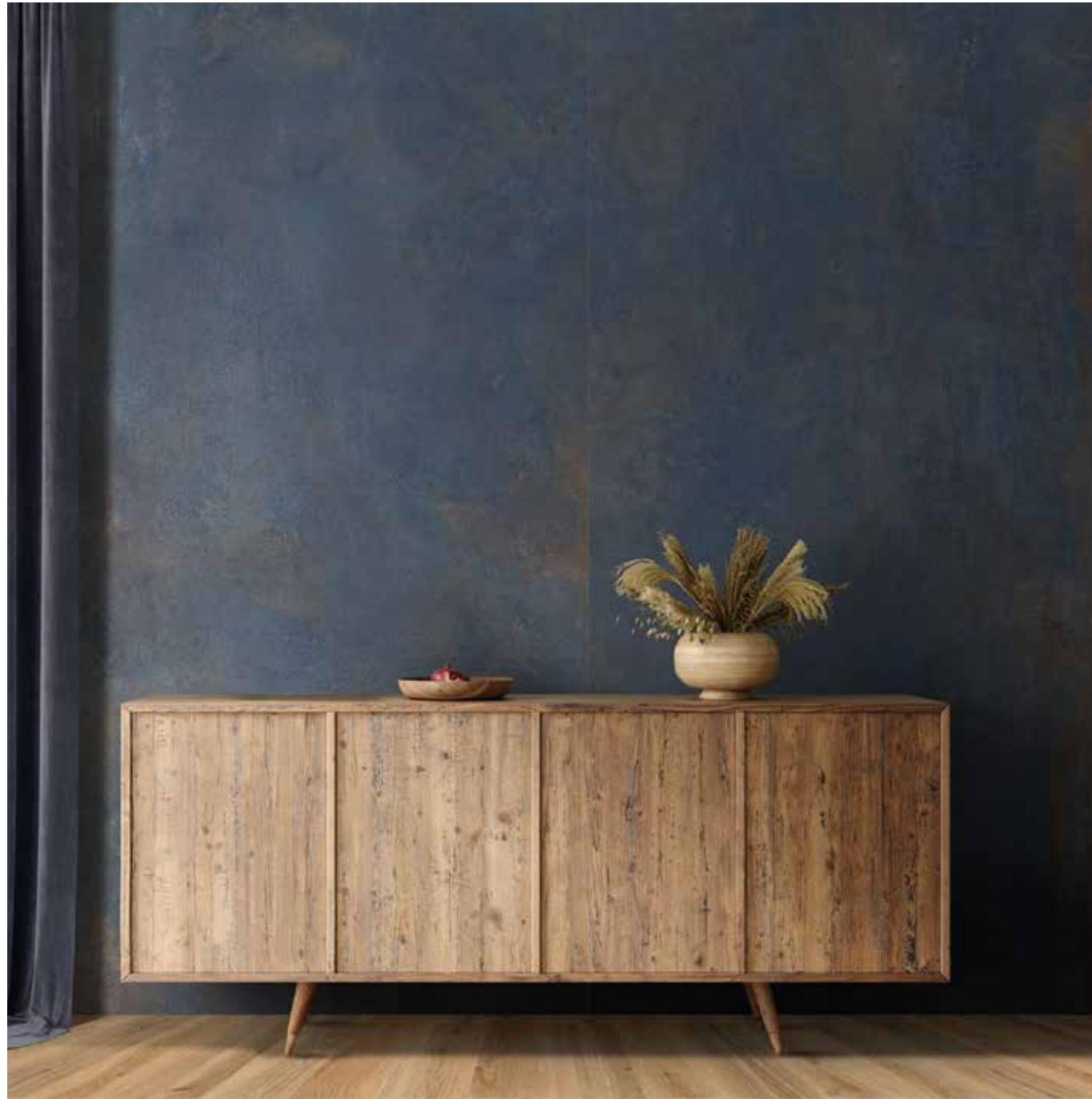
RIVESTIMENTO . WALL: Magnetic, Blue 120x280 . 48"x110", 6 mm - Rettificato . Rectified PAVIMENTO . FLOOR: Warm Style - Woodbreak, Oak 20x160 . 8"x64", 9 mm - Rettificato . Rectified